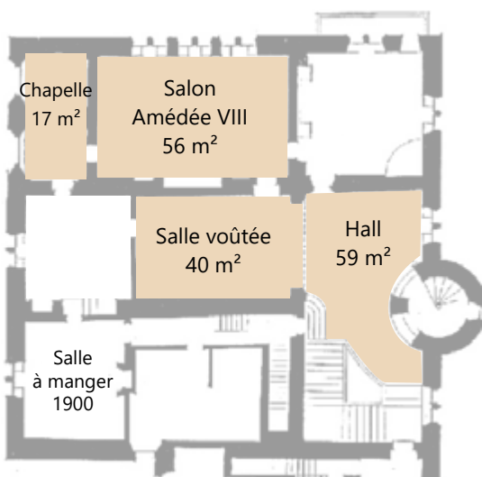
1 er ÉTAGE